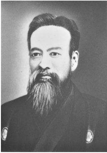
茨城県初代知事（参事） 山岡高歩

旧石器時代 縄文時代 弥生時代 古墳時代 奈良時代 平安時代 鎌倉時代 室町時代 江戸時代 明治・大正・昭和時代