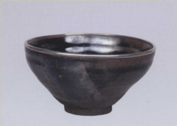
重要文化財 灰被天目茶碗(虹) 元時代