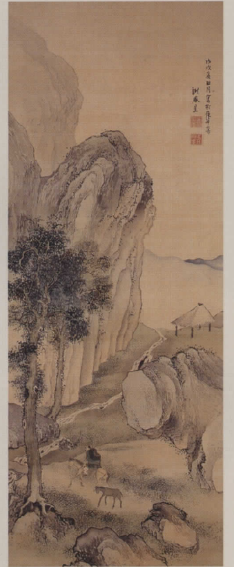
重要文化財 山林奥図 与謝蕪村筆 安永7(1778)年