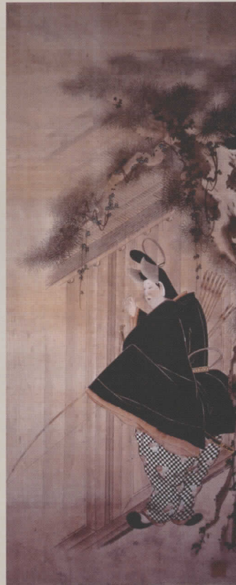
重要文化財 梓弓図 岩佐勝以筆 江戸時代

秋分の日を境に季節は確実に秋・・・日本人は四季のうつろいや自然の営みを芸術に表現してきました。季節や自然の姿に重点を置いて解説します。