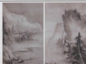
夏冬山水図 曾我紹仙筆