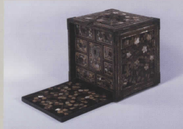
花鳥蒔絵小篋筒 桃山時代