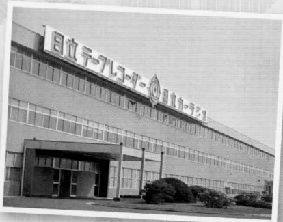
日立製作所旧東海工場

本展では、これら昭和30～60年代に日立製作所で製作された音響映像機器を中心に紹介します。高度経済成長期以降に、国内外で広く流通した茨城生まれの製品をぜひご覧ください。