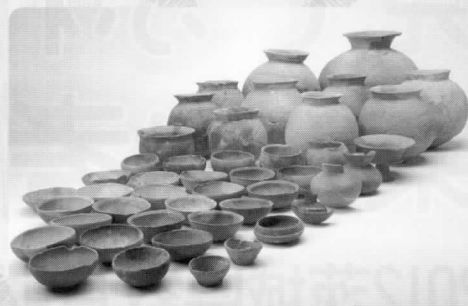
土師器と須恵器(つくば市古館明神脇遺跡)

また、調査遺跡と関連してこれまでに県内で出土した土偶(どぐう)を紹介するとともに、考古学の楽しさを体験できるコーナーをご用意します。先人たちの歩みを調査し、後世に残す考古学の大切さ・面白さを見て・ふれて体感してください。