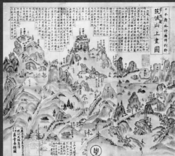
筑波山上画図(国立公文書館蔵)