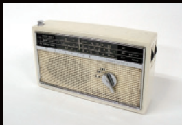
愛され続けて15年ロングベストセラーラジオ WH-859 (昭和37年)