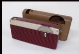
日立初のトランジスタラジオ TH-669 (昭和32年)