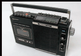
生産が間に合わない!? 大ヒットラジカセ TRK-1280 (昭和48年)