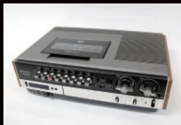
日立初のVHSビデオ VT-3000 (昭和51年)