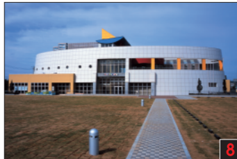
大洗町 大洗わくわく科学館 2001年7月オープン。国の「科学館」指定を受けた。1階と2階に分かれた展示室(1階では、遊泳を一望できる「太陽の広場」)。1階・2階の両方に、最新の展示内容。最新の展示内容。最新の展示内容。最新の展示内容。 Oarai Children's Science Museum 大洗児童科学館 오아라이현 아이과학관