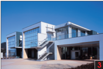
笠間市 茨城県陶芸美術館 笠間芸術の森公園内にある日本で初めての陶芸専門の独立美術館です。茨城出身で近代陶芸の祖ともいわれる板谷波山、笠間市で活躍した人間国宝・松井康成など、日本陶芸界の最高峰の作品が一堂に展示されています。その魅力です。 Ibaraki Ceramic Art Museum 茨城県陶芸美術館 이바라기현 도예미술관