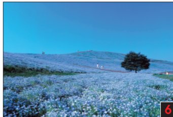
ひたちなか市 国営ひたち海浜公園 面積125ha(東京ドーム約25個)の広い園内には、大観音やジェットコースターなど20種類以上のアトラクションが楽しめる「ブルーガーデン」、見事な花が咲く約8haの大芝生、全長5kmのサイクリングコースなど、春から秋にかけては、花や緑が美しい。また、園内には、自然の恵みを感じながら楽しむことができる。Hitachi Seaside Park 国営ひたち海浜公園 이바라기현 해안공원