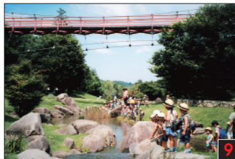
茨城町 潤沼自然公園 遠近の緑との自然を丸ごとアウトドア施設にした公園です。約34haの広さの中には、遊泳を一望できる「太陽の広場」。1階・2階の両方に、最新の展示内容。最新の展示内容。最新の展示内容。最新の展示内容。 Hinuma Natural Park 潤沼自然公園 이바라기현 자연공원