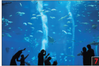
大洗町 アクアワールド・大洗 600の水槽に約500種、6万8000点もの生物を展示。水の生き物や環境について詳しく学ぶことができる水体験です。サメの遊泳は日本一の長さ。イルカやアシカのショーも楽しめます。 Ibaraki Prefectural Oarai Aquarium 大洗水族館 이바라기현 대수족관