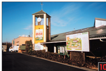
茨城町 ポケットファームどきどき 自然、農業、食べ物をテーマに、見る、考える、そして体験しようとするランドです。園内には、農産物直売所、レストラン、小さな動物園、フラワーパークなどがあります。地域で作られた新鮮野菜、手作りの加工品の数々、自然といっしょに楽しむことができます。 Pocket Farm Dokidoki 納豆農場 오뚜기농장