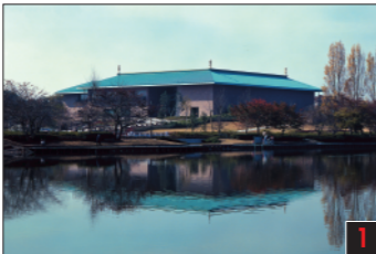
水戸市 茨城県近代美術館 信楽園から続く緑豊かな千波湖畔にある美術館。近代、現代の国内外多数の美術品を収蔵し展示公開。ロダンや横山大観の所蔵作品が鑑賞できる他、企画展や美術講座、講座なども開催しています。 The Museum of Modern Art Ibaraki 茨城県近代美術館 이바라기현 근대미술관