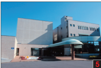
東海村 原子力機構アトムワールド 実験、模型、映像による原子力サイクリングの紹介と、大人も子供も科学をゲーム感覚で学べる施設です。 Atom World 原子世界 아톰월드