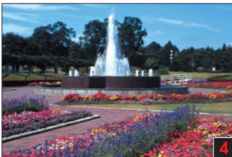
那珂市 茨城県植物園 巨大な園内では、約600種、約5万本の植物を回遊して楽しみながら鑑賞することができます。植物園に併設する納豆博物館でも、マクローブやライオンウツチなど希少なアサの栽培・産製が楽しめる約240種、約2万5千坪の植物を鑑賞することができます。 Botanical Garden, Ibaraki 茨城県植物園 이바라기현 식물원